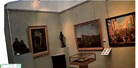
musée du Bardo -Alger-