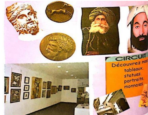
Musée des beaux- arts